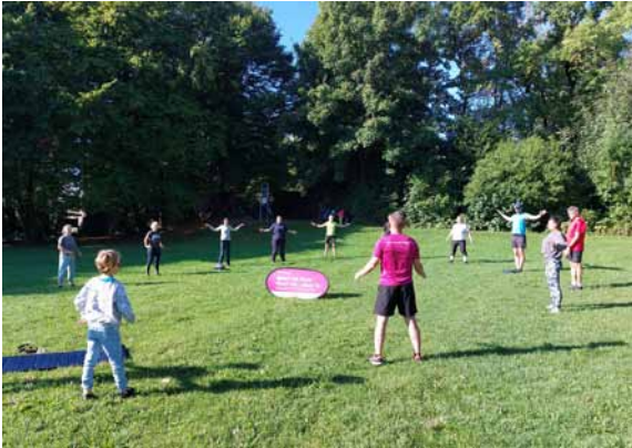
„Functional Fitness“ bei Sport im Park auf der Hostigwiese

Gemeinsam in der Gruppe an der frischen Luft etwas Gutes für den eigenen Körper tun: Das können Heidelbergerinnen und Heidelberger bei „Sport im Park“.