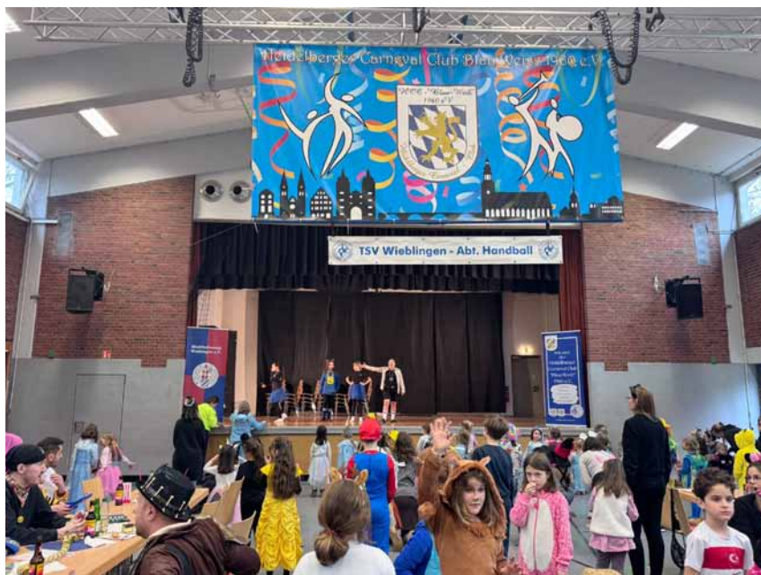
Kinderfastnacht in der Fröbelhalle

Ein besonderes Highlight war dabei die Kinderfastnacht in der Fröbelhalle. Diese Veranstaltung wurde gemeinsam vom Stadtteilverein, den TSV-Handballern und dem HCC organisiert. Dank der großzügigen Unterstützung engagierter Wieblinger Geschäftsleute – darunter die Bäckereien Breitenstein und Wacker, der Getränkehandel Fein sowie die Eismanufaktur OK kool – wurde das Fest zu einem großen Erfolg und zauberte vielen Kindern und Familien ein Lächeln ins Gesicht.