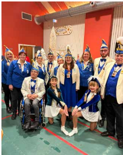
Der Elferrat des HCC

Auch wenn die närrische Zeit längst vorbei ist, blickt unser Heidelberger Carneval Club Blau Weiß 1960 e.V. auf eine rundum gelungene Kampagne 2025/2026 zurück. Mit zahlreichen Veranstaltungen und viel Engagement aller Aktiven konnten wir wieder viele Menschen begeistern und gemeinsam unvergessliche Momente erleben.