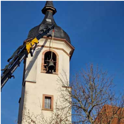
Entnahme aus dem Alten Kirchturm,