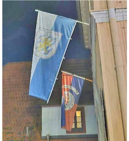
Am 11.11 wurde mit Pauken, Trompeten und den Hendsemer Herolden das Wieblinger Rathaus gestürmt und die HCC – Fahne gehisst.