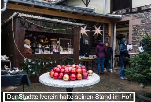
Der Stadtteilverein hatte seinen Stand im Hof