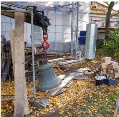
Abstellen am Neuen Kirchturm