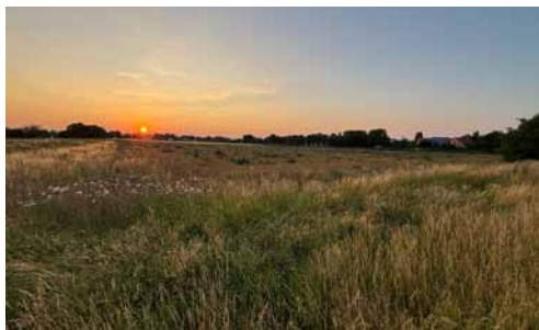
Die Wiese vor der Bebauung

Fast hätte es die Wiese an der nördlichen Ortsgrenze von Wieblingen in den Wieblingen Kalender 2026 geschafft. Pia Latini, die regelmäßig Fotos für den Kalender beisteuert, war von dem Anblick der blühenden Wiese im vergangenen Sommer begeistert und hat sie mehrfach fotografiert.