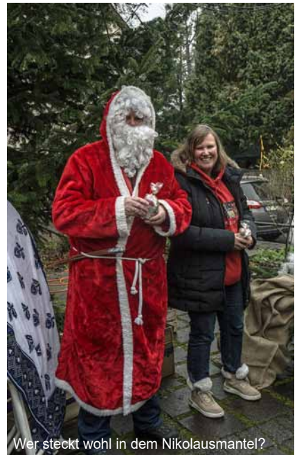
Wer steckt wohl in dem Nikolausmantel?