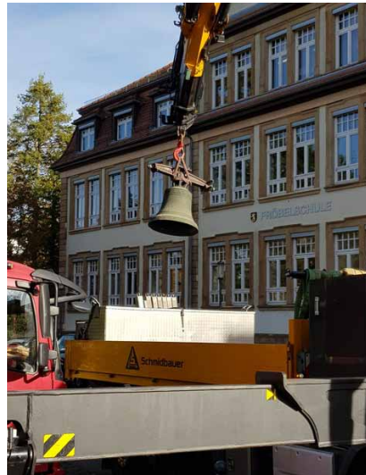
Abladen vom Lastwagen