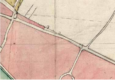
Ältester Plan der Wieblinger Gemarkung

Immer wieder hört man in Wieblingen die Meinung, die Kreuzstraße sei nach der daneben liegenden Kreuzkirche benannt. Das trifft nicht zu. Die evangelische Pfarrkirche wurde 1905/06 erbaut und hatte zunächst keinen Namen. Erst zum 20jährigen Weihejubiläum 1926 wurde sie „Kreuzkirche“ benannt. Dagegen trug schon lange vor dem Bau der Kreuzkirche die danebenliegende Straße den Namen „Kreuzgasse“ und wurde zwischen 1895 und 1900 in „Kreuzstraße“ umbenannt.