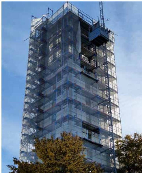
Der eingepackte Glockenturm der Kirche St. Bartholomäus

Sanierung und Umbau nicht nur in technischer Hinsicht