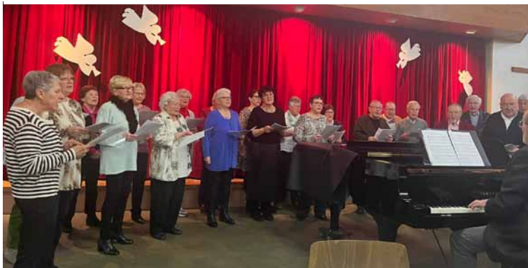
Das gehört zur Weihnachtsfeier einfach dazu: Das Singen von Weihnachtsliedern