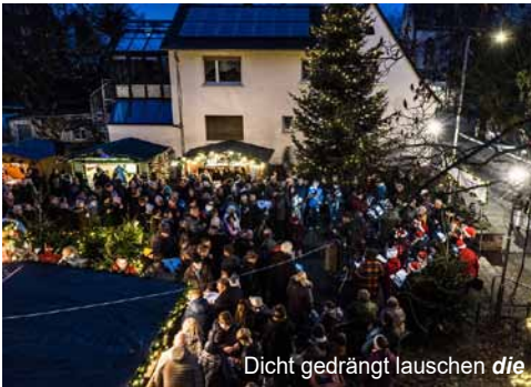
Dicht gedrängt lauschen die Besucher der Musik zur Eröffnung