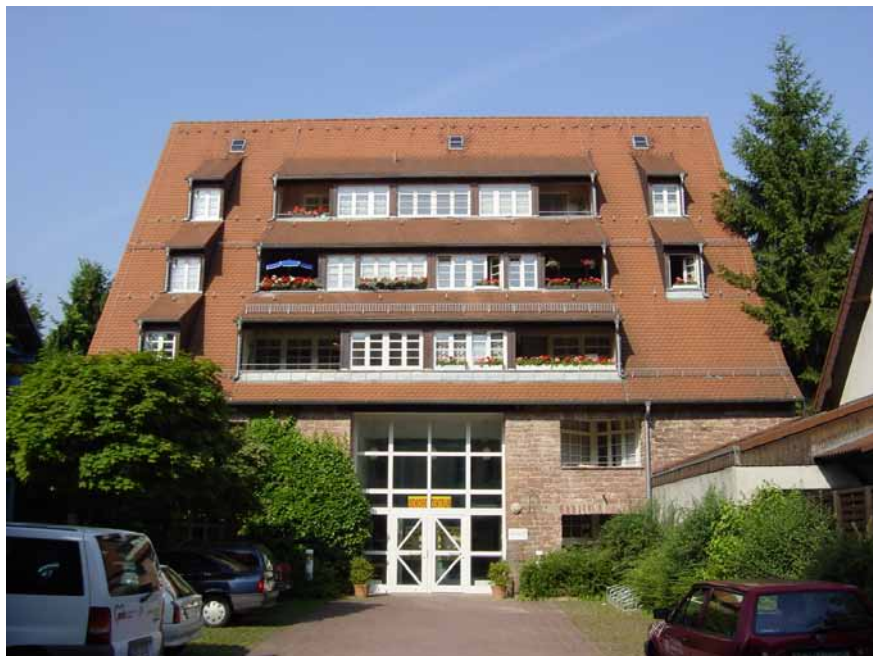
In dieser umgebauten ehemaligen Scheune ist seit 1991 das AWO-Seniorenzentrum untergebracht.