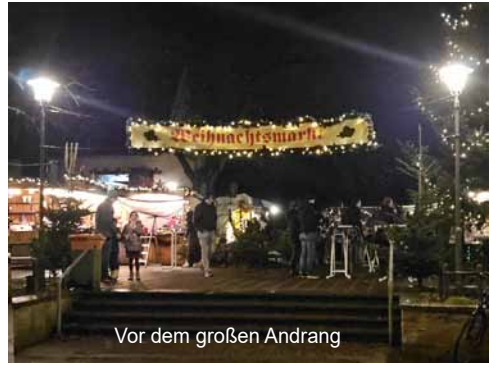
Vor dem großen Andrang