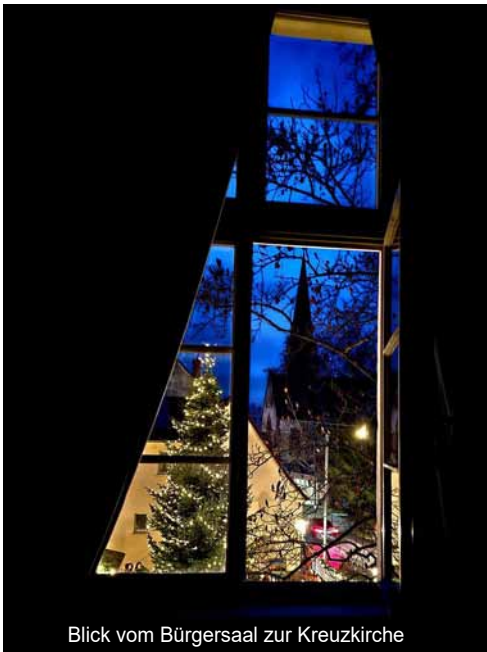
Blick vom Bürgersaal zur Kreuzkirche