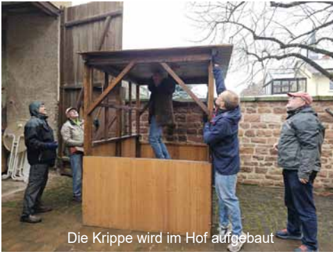
Die Krippe wird im Hof aufgebaut