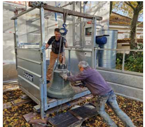
Einladen in den Förderkorb des Turmgerüsts