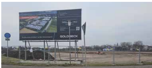
Die Bauinformation seit Dez. 2025

Als die Bagger anrückten und die Wiese umgegraben wurde, konnte nur spekuliert werden. Erst Mitte Dezember informierte ein Werbeplakat, das am Rand der Wiese aufgestellt wurde, dass die Wiese mit einem sogenannten Gewerbepark bebaut wird, wo ca. 20.000 qm Bürofläche