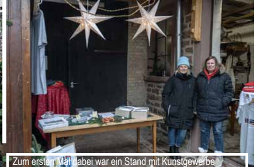
Zum ersten Mal dabei war ein Stand mit Kunstgewerbe