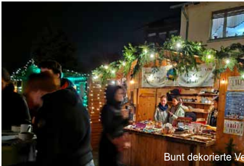
Bunt dekorierte Verkaufsstände