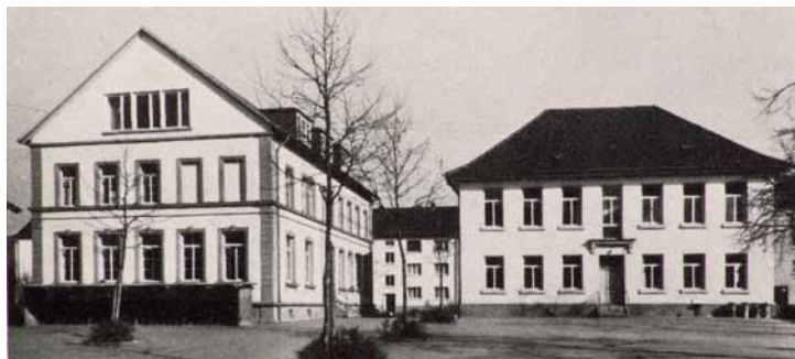
Bau I (rechts) und Bau II der Fröbelschule 1965