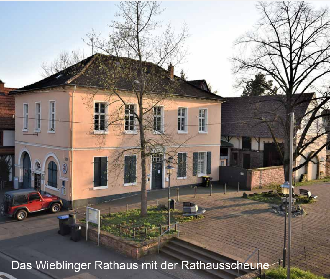
Das Wieblinger Rathaus mit der Rathausscheune

NACHRICHTEN UND INFORMATIONEN AUS DEM STADTTTEIL