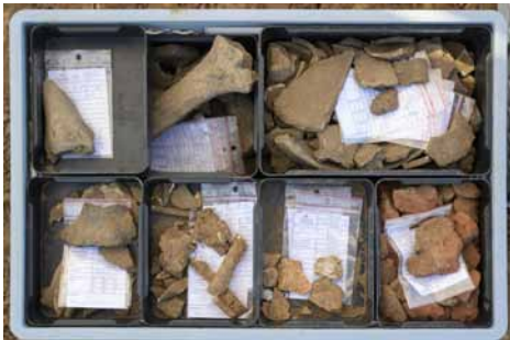
Zahlreiche Funde (bes. Scherben) in Einzelkistchen

Es ist schon recht vielfältig, was da zum