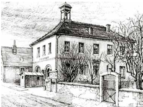
Das Wieblinger Rathaus um 1910 noch mit Glockentürmchen und Waagehäuschen; rechts der Bühlersche Garten (heute Rathausplatz) mit dem Tor, das noch heute hinter dem Rathausplatz steht. (Zeichnung von Otto Hoffmann)

Während des Dritten Reiches hatte die örtliche NSDAP im Rathaus ihre Zentrale, und