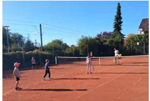
Ein erfreulicher Anblick: Endlich sind wieder Kinder beim Training auf den Tennisplätzen