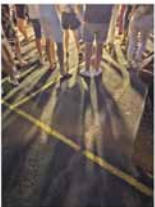
Am Samstag Abend wurde gerockt: Der Auftritt der T-Band