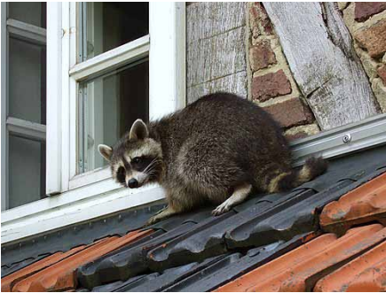
Waschbär auf einem Dach

Den Anrufern, die um Rat bitten, empfiehlt die Wildtierbeauftragte zum Beispiel, etwas Schweres auf die Mülltonnendeckel zu legen oder, wenn die Tiere ins Dach klettern, benachbarte Bäume zurückzuschneiden. Aber nach ihrer Beobachtung würden die Waschbären immer schlauer und zudringlicher.