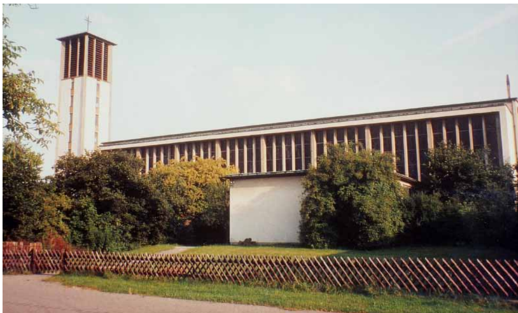
Die Pfarrkirche St. Bartholomäus vor dem Abriss der ursprünglichen Sakristei

Damit enden kirchenrechtlich alle katholischen Pfarreien der Stadt – teilweise nach etwa 350 Jahren ihrer Existenz; denn die meisten sind ja nach der Reformationszeit entstanden, als 1685 der Katholizismus wieder in der Kurpfalz zugelassen und stark gefördert wurde. Gründe