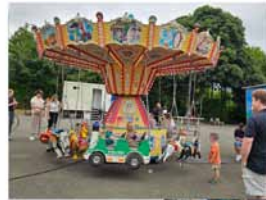
Jubel, Trubel, Heiterkeit