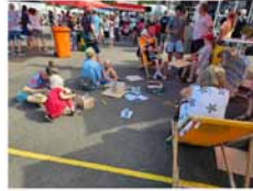
Beim StV war Kreativität gefragt