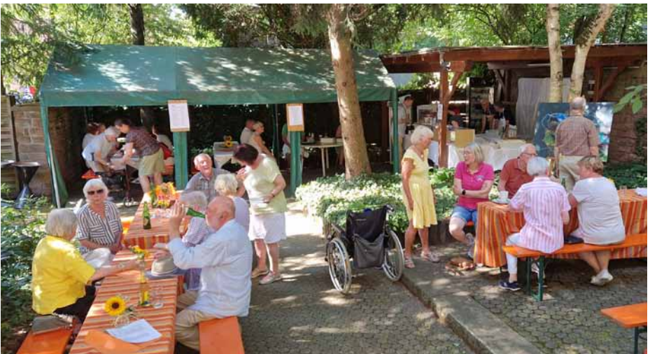
Schattige Plätze unter den Bäumen waren gefragt