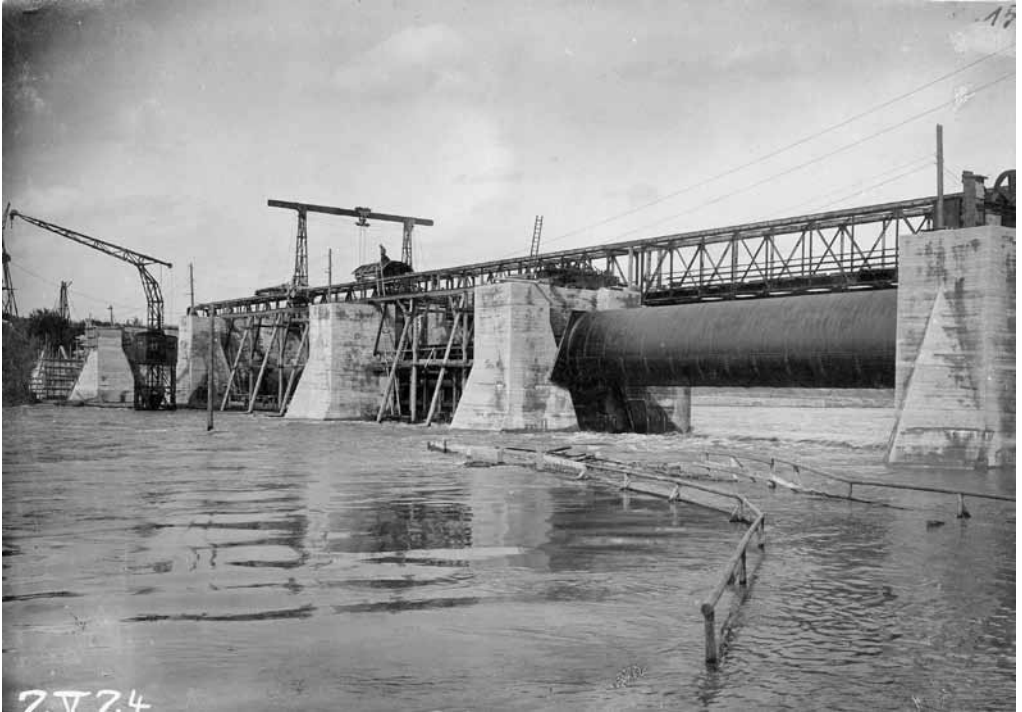
Der Bau des Stauwehrs wurde mehrfach von Hochwasser behindert. (1924)

Danach wurde das Wasser zunächst wieder abgelassen; die offizielle Eröffnung war am 15.6., und im Juli wurde dann die reguläre Schifffahrt im Kanal aufgenommen, indem ein Schleppdampfer einen Zug von Frachtkähnen hinter sich her zog. Da ja nur diese erste Staustufe vollendet war,