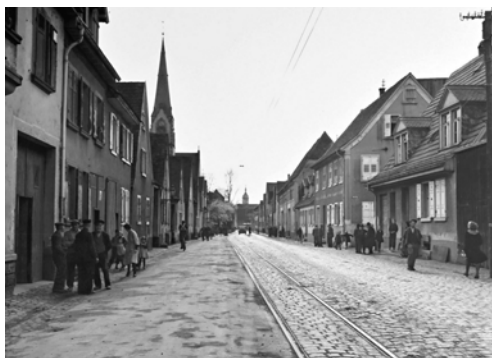
Amerikanischer Bildtext (übersetzt): „Zivilisten versammeln sich in den Straßen von Wieblingen bei Heidelberg, um über die Einnahme ihres Ortes zu sprechen. 31. März 1945.“ (Wahrscheinlich Datum falsch). Es ist interessant, Straße und Häuser mit heute zu vergleichen!

Sofort nach dem Einmarsch wurde das gesamte Schlossgelände, das schon von der Thaddenschule verlassen worden war, beschlagnahmt; es war zunächst mit Amerikanern belegt, dann zeitweise mit Franzosen (und Marokkanern), dann wieder mit Amerikanern. In dieser Zeit wurde ein Großteil der Inneneinrichtung zerstört und, was besonders bedauerlich ist, ging ein Großteil der Schulakten verloren. Die Amerikaner verbreiteten sogar das Tor, um mit ihren Panzern hindurchfahren zu können. Der Park wurde von Panzern und Fahrzeugen sehr hart mitgenommen. In der Schlosskapelle lagerten die Amerikaner Öl- und Benzinfässer; entsprechend ruiniert