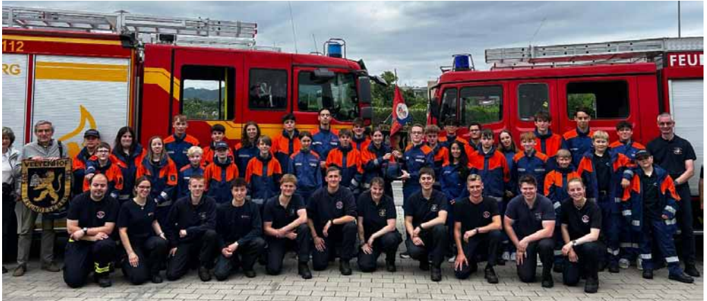
Die 30 Jugendlichen und Betreuer hatten viel Spaß beim Besuch in Wieblingen

Das Highlight war jedoch eindeutig das gemeinsame Zeltlager mit der Jugendgruppe unserer Freunde der Feuerwehr Veltenhof . Im vergangenen Jahr, 50 Jahre nach dem ersten Treffen unserer Wehren überhaupt, fand ein gemeinsames Zeltlager in Veltenhof statt.