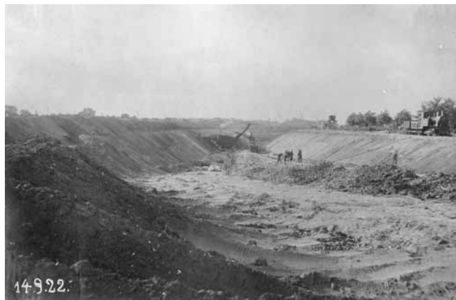
Das Kanalbett wird ins Neuenheimer und Handschuhsheimer Feld gegraben. Im Hintergrund Wieblingen mit den Kirchtürmen. (14.9.1922)

Deshalb plante man schon ab den 1880er Jahren den Ausbau des Neckars zu einer Großwasserstraße. Dazu sollte der Neckar in bestimmten Abständen aufgestaut und somit der Wasserstand deutlich erhöht werden. Die Schiffe sollten die Stauwehre durch Schleusenammern