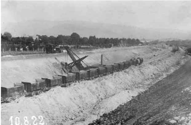
Die Baustellenbahn muss riesige Mengen Aushub wegfahren. Im Hintergrund die OEG-Güterbahn-Brücke („Schwarze Brücke“) (10.8.1922)

Die Verwirklichung konnte wegen des Ersten Weltkrieges erst im Herbst 1920 beginnen. Um die große Arbeitslosigkeit zu bekämpfen, starteten die Bauarbeiten an mehreren Stellen gleichzeitig. Die ersten Wehre waren Ladenburg und Wieblingen; allein im Bereich Wieblingen/Schwabenheim waren zeitweise 1500 Arbeiter beschäftigt. Die gewaltigen Erdmassen des Kanalausbaus wurden teilweise dafür verwendet, durch Überschwemmung gefährdete Abschnitte des Neuenheimer Neckarufers aufzufüllen.