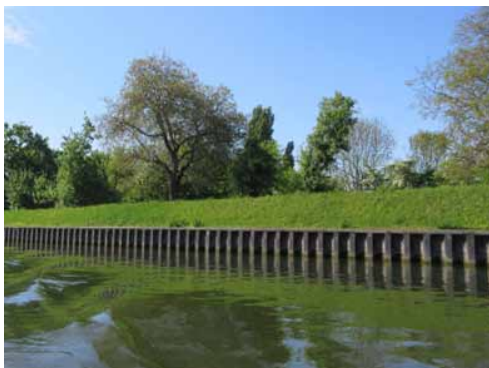
Seitliche Spundwand am Neckarseitenkanal

dicht besiedelten Umfeld. Die Entfernung der Ufervegetation bedeutet daher einen drastischen Eingriff in das sensible Ökosystem.