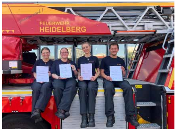
Vier frisch gebackenen „Truppfrauen/-männer“ nach Ende der Grundausbildung

Ende Mai haben vier Kameradinnen und Kameraden erfolgreich ihre Grundausbildung beendet. An 10 Ausbildungstagen haben sie das notwendige Grundwissen in Brandbekämpfung und technischer Hilfe sowohl in theoretischen, vor allem aber bei praktischen Ausbildungen und Übungen erlernt. Die schriftliche und praktische Prüfung haben alle mit Bravour gemeistert!