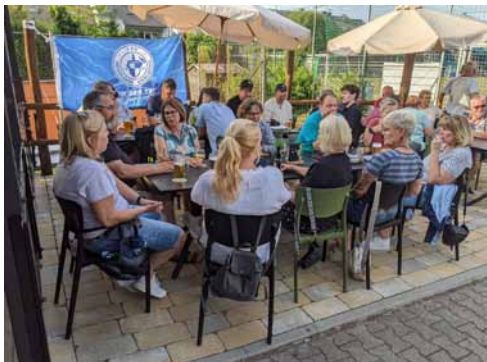
Die Terrasse wurde neu gestaltet

auf alle Gastronomen zu: Es fehlte an Personal. Viele im Gastgewerbe Tätige hatten sich während der Coronazeit eine andere Beschäftigung gesucht und standen dem Gastgewerbe nicht mehr zur Verfügung. So kam es, dass das Vereinslokal erst in diesem Jahr wieder eröffnet werden konnte. Am Mittwoch, dem 18. Juni, war es dann soweit: Wer sich angemeldet hatte, war zu einem kalten Buffet eingeladen und konnte aus einer kleinen Speisekarte Pizza und Pasta testen. Eine offizielle Eröffnung findet nach den Sommerferien statt, hierzu werden auch Vertreter des TSV Wieblingen persönlich eingeladen.