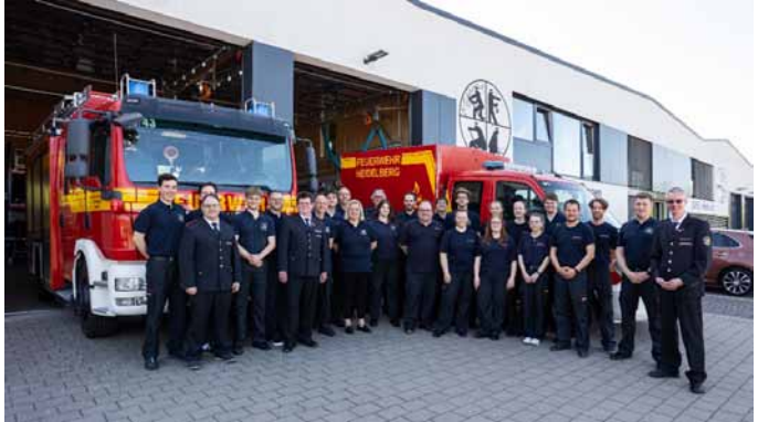
Die Mannschaft nach den Abteilungswahlen

Mit 23 Alarmen war es ein recht ruhiges Einsatzjahr, dennoch waren unsere 43 Feuerwehrangehörigen rund 41 Stunden im Einsatz – vom Hochwasser betroffene Keller, über einen Küchenbrand bis zur Besetzung der Wache der Berufsfeuerwehr, wenn die dortigen Kräfte länger bei einem anderen Einsatz ge-