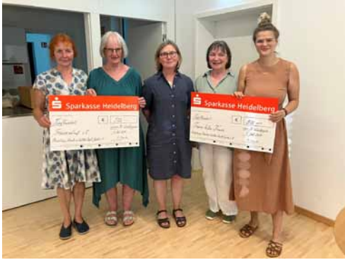
Bei der Scheckübergabe an die Vertreterinnen vom Frauennotruf und „Frauen helfen Frauen“

Unsere Jubiläumsausstellung anlässlich des 35-jährigen Bestehens der Gilde (siehe Wieblinger Anzeiger Nr. 22) war ein großer Publikumserfolg. Und auch der Losverkauf für die drei zu gewinnenden Quilts lief ausgezeichnet und erbrachte eine schöne Summe. Sicher lag das auch daran, dass die Einnahmen dem Frauennotruf e.V. und „Frauen helfen Frauen“ zugute kommen sollten.