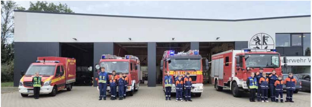
Der Löschzug ist eingeteilt

Los ging es am Samstag, 15. September, um 7.30 Uhr: Dienstantritt der „Berufsjugendfeuerwehr Wieblingen“.