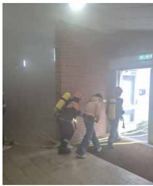
Brand im Klassenzimmer

Aber auch bei den Einsätzen hatten sich unsere Betreuer mächtig ins Zeug gelegt, um anspruchsvolle und vor allem einsatzrealistische Lagen zu bieten: einen in echt gefluteten Schacht galt es auszupumpen oder ein verrauchtes Klassenzimmer abzusuchen und mehrere Schüler ins Freie zu bringen, die vom Schulsanitätsdienst versorgt wurden.