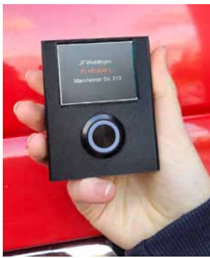
„Funkmeldeempfänger“ sorgten für Spannung auf den nächsten Einsatz