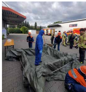
Verdächtigtes Pulver löste einen Gefahrguteinsatz aus

Hier bedanken wir uns sehr bei der Elisabeth-von-Thadden-Schule und Getränke Fein, die uns ohne zu zögern diese tollen Übungen in ihren Objekten ermöglicht haben!