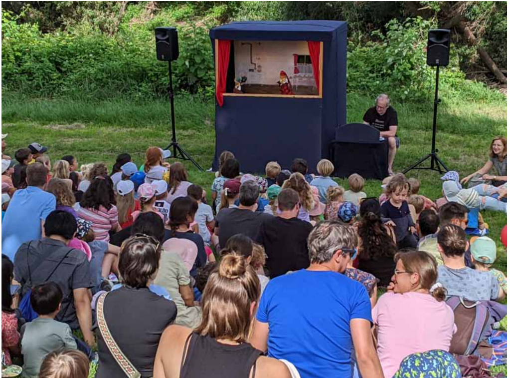
Aufmerksame Zuschauer beim Neckarfest 2024 auf der Neckarwiese