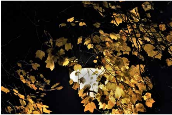
Herbstliche Färbung des Tulpenbaums am Rathausplatz