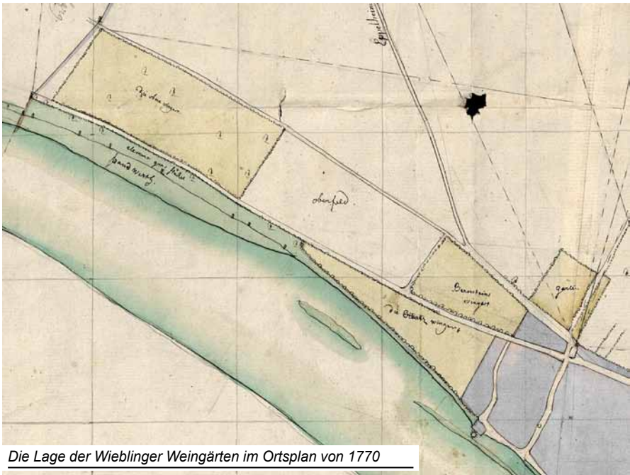
Die Lage der Wieblinger Weingärten im Ortsplan von 1770