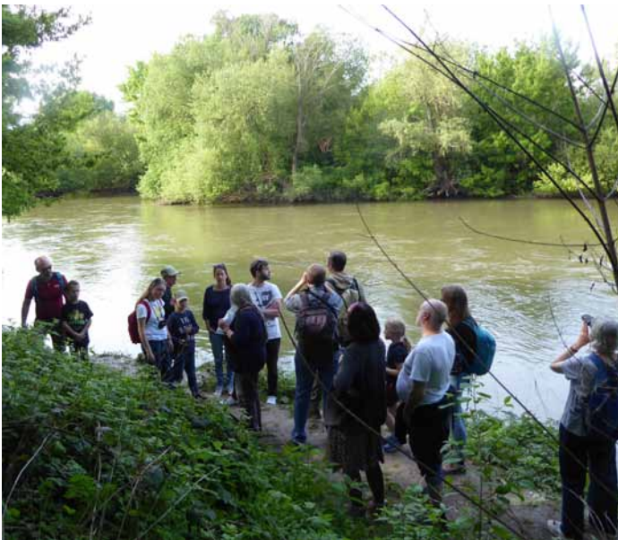
Zweimal im Jahr bietet die BUND-Ortsgruppe Naturführungen am Altneckar an